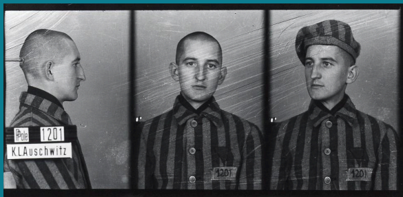
FOTOGRAFIE OBOZOWE FRANCISZKA BLACHNICKIEGO

Twórca Ruchu Światło-Życie urodził się 24 marca 1921 roku w Rybniku. Rodzina Blachnickich wielokrotnie się przeprowadzała ze względu na obowiązki służbowe ojca przyszłego księdza. Franciszek ukończył Gimnazjum w Tarnowskich Górach. Działal bardzo aktywnie w harcerstwie. W 1938 roku zdał maturę i podjął służbę wojskową. Brał udział w kampanii wrześniowej, a po jej klęsce angażował się w działalność konspiracyjną. Zdekonspirowany w marcu 1940 roku był zmuszony do ucieczki przed gestapo. Ujęty i aresztowany w Zawichoście, był przesłuchiwany i po kilku tygodniach został skierowany do obozu koncentracyjnego w Oświęcimiu. We wrześniu 1941 roku został przeniesiony do więzienia w Hindenburgu (Zabrze), a potem do Katowic, gdzie w 1942 roku został skazany na karę śmierci przez ścięcie za działalność konspiracyjną przeciwko Rzeszy. Po ponad 4,5 miesiącach oczekiwania na wykonanie wyroku, został ułaskawiony, a karę zamieniono na 10 lat więzienia po wojnie. 17 czerwca 1942 roku czasie pobytu w celi śmierci dokonało się nagłe nawrócenie Franciszka Blachnickiego i podjął decyzję o wiecznej służbie Bogu. Przebywał jeszcze w kilku więzieniach i obozach, co skutkowało problemami zdrowotnymi. Po zakończeniu wojny, wstąpił do Wyższego Śląskiego Seminarium Duchownego w Krakowie, aby 25 czerwca 1950 roku przyjąć święcenia kapłańskie