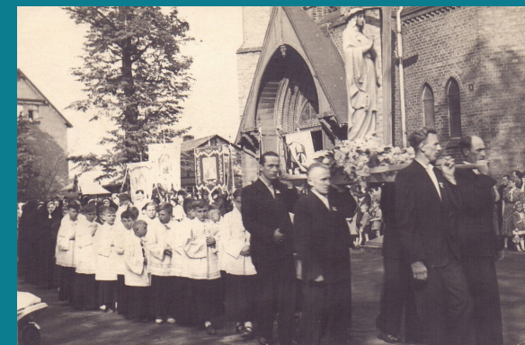
RYDUŁTOWSCY MINISTRANCI W TRAKCIE PROCESJI