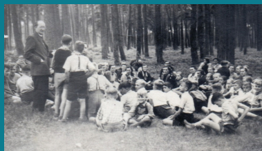
OAZA DZIECI BOŻYCH W BIBIELI W 1954 ROKU